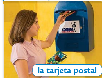
la tarjeta postal