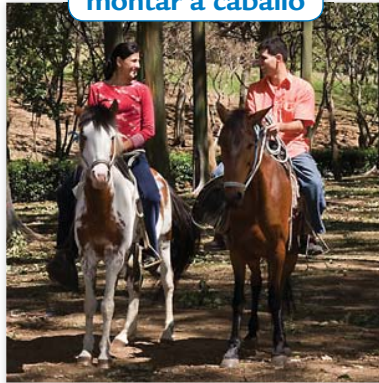
montar a caballo