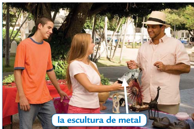
la escultura de metal