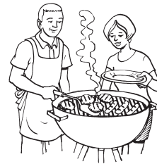
4. mis padres