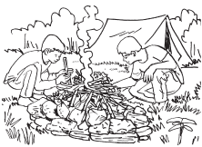
1. los chicos