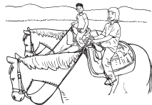
3. los amigos