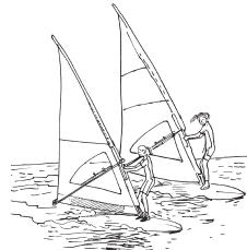
2. mi hermana