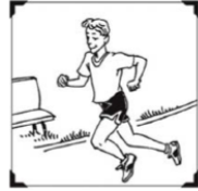
24. A ti