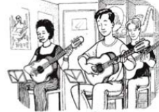
25. A ellos