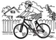
23. A ustedes