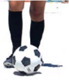
22. A mí.

Write complete sentences describing what these people like to do according to the illustrations. (3 pts. each)